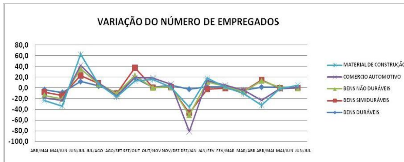
Gráfico 2: Variação do percentual mensal do nível de emprego segundo o ramo de atividade.